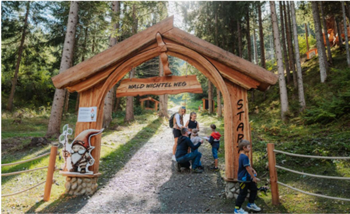
Il nuovo sentiero degli gnomi del bosco nel Wichtelpark Sillian, nell' Osttirol, in Austria, offre ai bambini una divertente opportunità di scoprire il bosco in modo giocoso e di trovare un tesoro perduto.

L'area della foresta contiene il 90% di particelle di polvere in meno rispetto alla città. Nell' Osttirol, circa 680 chilometri quadrati sono coperti da questa area ricreativa che favorisce la salute. Chi si immerge nel silenzio durante le escursioni, le passeggiate in bicicletta o i bagni nella foresta trova la pace interiore e si ricarica. Gli scienziati sono convinti che l'ambiente verde protegga persino dalla depressione, dallo stress mentale, dall'esaurimento nervoso e dagli attacchi di cuore e possa alleviare il dolore cronico. Una passeggiata nell'Oberhauser Zirbenwald nella valle Defereggental, la più grande foresta contigua di pini cembri delle Alpi orientali, o una visita al sentiero naturale e culturale della valle Debanttal invitano a sperimentare la forza degli alberi circondati da 266 cime di tremila metri. Con attrazioni come il nuovo sentiero Waldwichtelweg nel Wichtelpark, parco degli gnomi di Sillian, la natura diventa un parco giochi per grandi e piccini. In sette stazioni interattive, le famiglie cercano un tesoro perduto e scoprono i segreti del bosco. Coraggio, abilità e spirito di squadra sono richiesti quando i bambini si arrampicano sulle cime degli alberi, si aggirano nei labirinti o scavano per trovare monete nascoste nel "tunnel del cercatore d'oro".