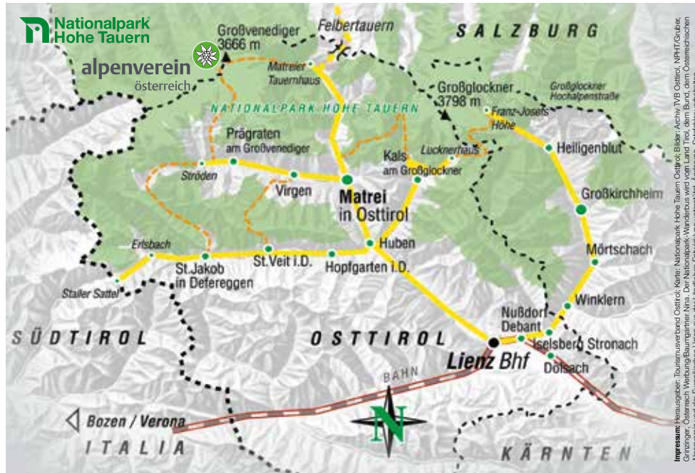
Impressum: Herausgeber: Tourismusverband Osttirol; Karte: Nationalpark Hohe Tauern Osttirol; Der Nationalpark-Wanderbus wird vom Land Tirol, dem Bund, dem Österreichischen Alpenverein und der Europäischen Union aus der Europäischen Entwicklung unterstützt. Anpassung: Satzplattler, Vorarlberg.

Österreichischer Alpenverein ..... www.alpenverein.at Nationalpark Hohe Tauern ..... www.hohetauern.at Tourismusverband Osttirol ..... www.osttirol.com